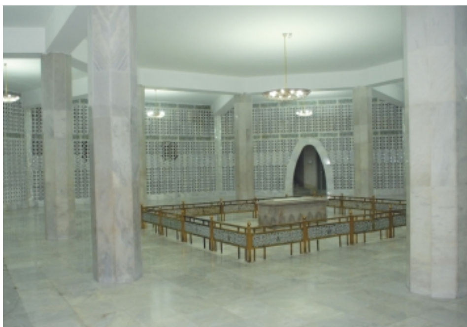
Настоящее захоронение Али Джинны на нижнем уровне пантеона