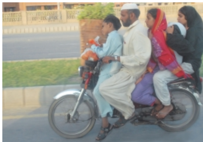
Четверо на одном мопеде – не предел

Огромный пакистанский город-порт Карачи расположен на самом юге страны и поэтому жители более северных стран чувствуют там себя словно в сауне: + 29 и влажность, исходящая от Аравийского моря.