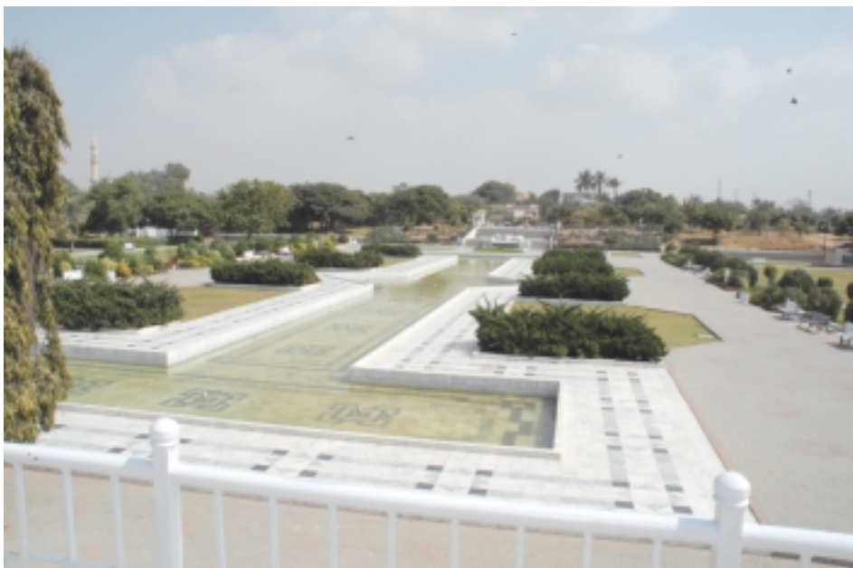
Площадь-парк перед мавзолеем Али Джинны

Мавзолей Мохаммада Али Джинны – прекрасный «шатер» из белого мрамора построен на холме, благодаря чему величественно возвышается над городом. Вокруг него на большой территории раскинулся прекрасный ухоженный парк, в котором гуляют горожане. А над мавзолеем в голубом небе парят орлы – гордые свободолюбивые птицы.