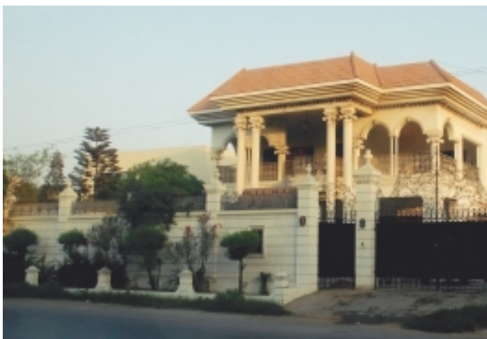
Особняк на побережье