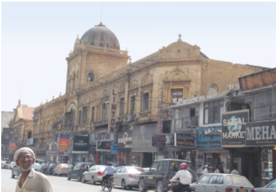
Одна из центральных торговых улиц Карачи