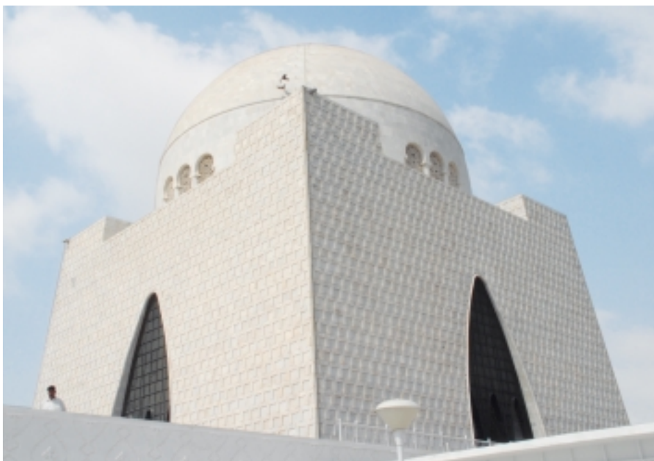
Мавзолей Мохаммада Али Джинны

Закон об управлении Индией, принятый в 1935 году, значительно расширил права индийских министров, что привело к обострению разногласий между двумя ведущими конфессиями. Мусульмане, проживавшие в провинциях, где преобладали индусы, считали, что их права