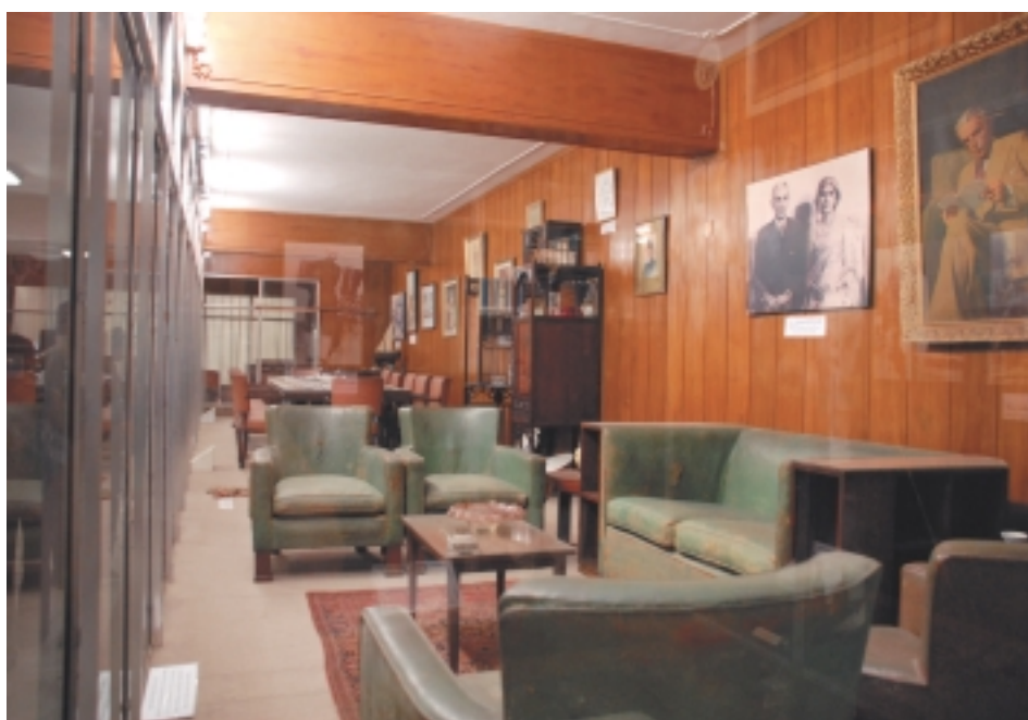
Рабочий кабинет, спальня, столовая в музее «Каид-и-Азама» – «великого лидера», «отца нации»

В мавзолее круглосуточно дежурит почетный караул: пехотинцев сменяют моряки, десантников – летчики и так далее. Пантеон – двойной: наверху на всеобщее обозрение представлен макет гробницы, а само захоронение Джинны находится уровнем ниже, под землей, куда обычно никого не допускают. Но нам разрешили спуститься. Тот же белый, с прожилками мрамор, великолепный ручной орнамент стен, узорная ковчаная решетка, идеальная чистота.