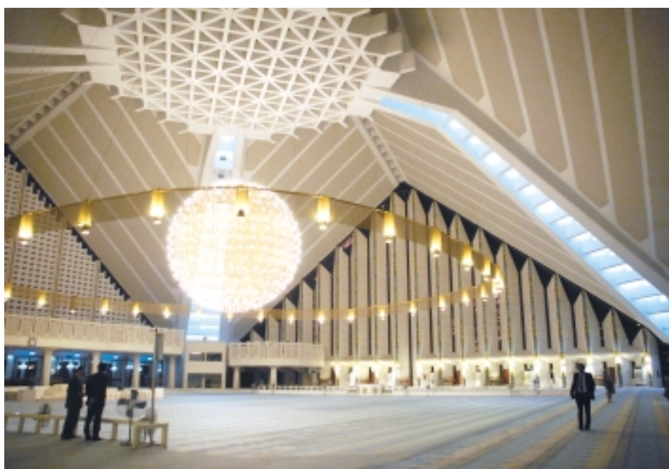
Внутренний зал самой большой в мире мечети Шах-Фейсал-Масджид

Побывали мы также в Национальном музее , где познакомились с древнейшей историей Пакистана, с его становлением в качестве современной республики. У входа нас встретили музыканты, играющие на старинных инструментах, и исполнили специально для нас несколько мелодий. На территории музея рядом с телегой, запряженной двумя буйволами, стоит вполне современный, разрисованный в национальном стиле грузовик. Темные, украшенные ручной резьбой двери, старинные кресла и скамейки перед входом в здание музея дают понять – здесь можно познакомиться не только с бытом предков, но и с мастерством умельцев, секреты которых были переданы потомкам. Раз-