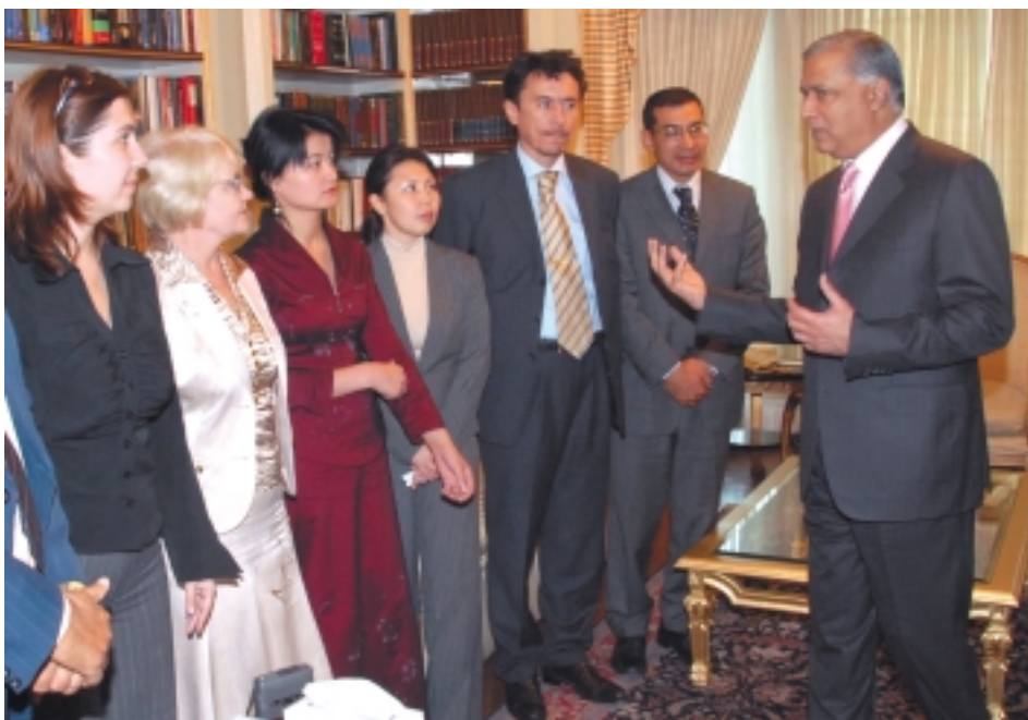
Казахстанская делегация на встрече с премьер-министром Пакистана Шаукатом Азизом

лет, т. е. общество Пакистана можно назвать молодым. Мы хотим обеспечить нашу молодежь качественным образованием, навыками и вложить все усилия во благо будущего страны. И это – предмет особого внимания правительства Пакистана.