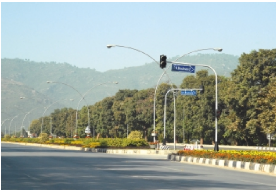
Широкие улицы Исламабада украшают стильные по дизайну фонари