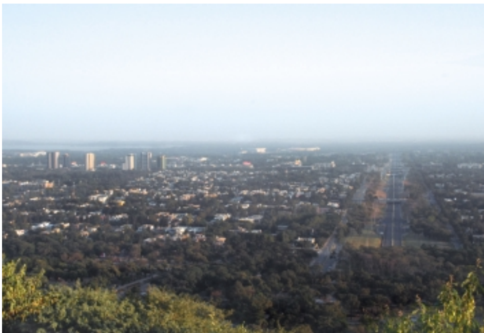
Панорама Исламабада, открывающаяся со смотровой площадки горного парка Damani-e-Koh

блоком раскинулся административный район. Одно за другим здесь стоят здания Парламента, резиденция премьер-министра, различных министерств, Суда, NADRA, Центрального банка, отдельно сконцентрированы посольства. Все здания – оригинальной современной планировки и в основном из белого камня – очень эффектно смотрятся на фоне гор. Исламабад – город невысокий, лишь несколько зданий выделяются своими габаритами, когда смотришь на город со смотровых площадок, устроенных на окружающих предгорных холмах.