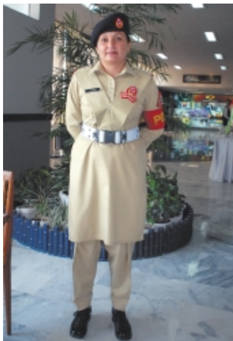
Сотрудница оружейного завода

Но все же было и несколько познавательных экскурсий: для нас было организовано посещение оружейного завода , где, к нашему удивлению, работают много женщин – как вольнонаемные, так и военнообязанные. Городок фактории – очень чистый, ухоженный и зеленый. Здесь имеются детские учреждения – садики и школы,