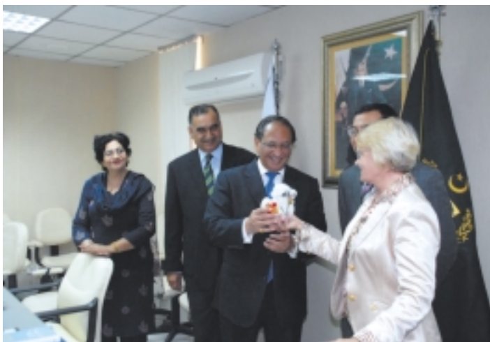
Символический подарок из Казахстана министру информации г-ну Таригу Азиму Хану от журнала STYLE

Поскольку большую часть нашей делегации составляли представители СМИ Казахстана, важным событием визита стала официальная встреча в министерстве информации Пакистана.