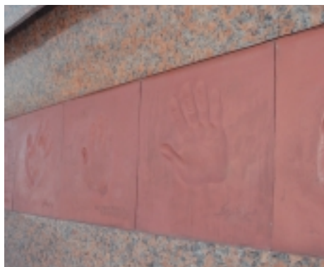
Отпечатки ладоней строителей Монумен-та Пакистана

Взглянуть на город с противоположной стороны можно со смотровой площадки Монумен-та Пакистана, возвышающегося на холме. Это большой комплекс с колоннами, каскадом лестниц и зелеными аллеями, опоясывающими подножие. Центральная часть Монумен-та состоит из четырех гигантских «парусов», смыкающихся вверху. Они символизируют собой четыре административных района Пакистана, четыре основных народности, населяющих эту землю. На каждом из фрагментов этих «парусов» высечены основные вехи истории провинций Пенджаб, Синд, Северо-Западная пограничная и Белуджистан. В центре - большой «звездный фонтан». По балюстраде лестницы, ведущей от подножия Монумен-та, расположены плиты с отпечатками ладоней строителей этого сооружения.