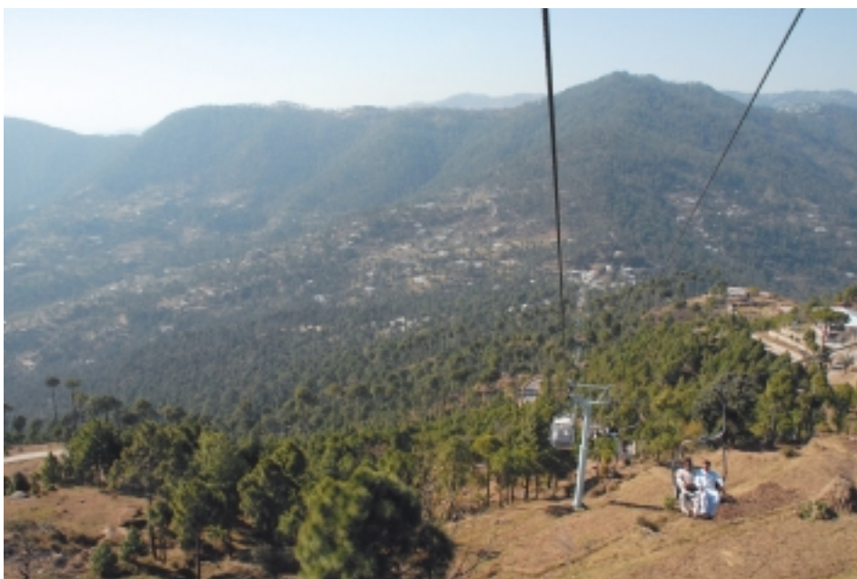
Горный район Мари. Вид с канатной дороги