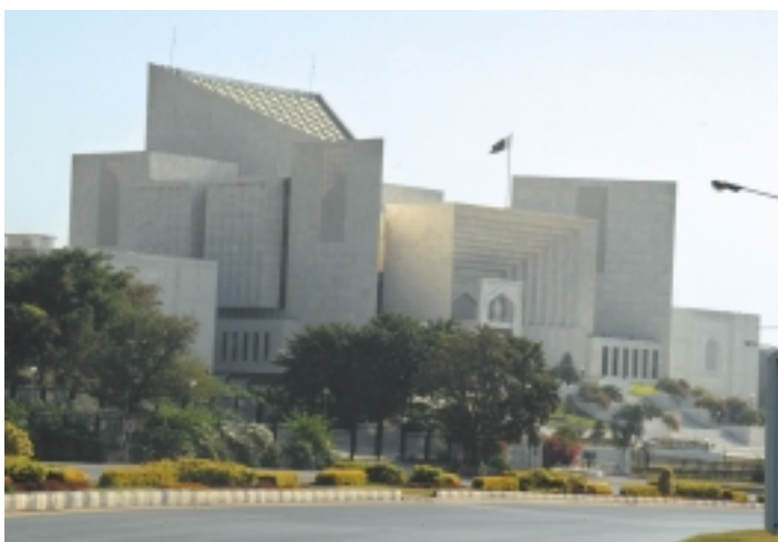
Здание Верховного суда Пакистана – одно из самых красивых по архитектуре административных сооружений Исламабада

О спокойствии горожан пекутся усиленные наряды полиции. Поэтому город безопасен. На