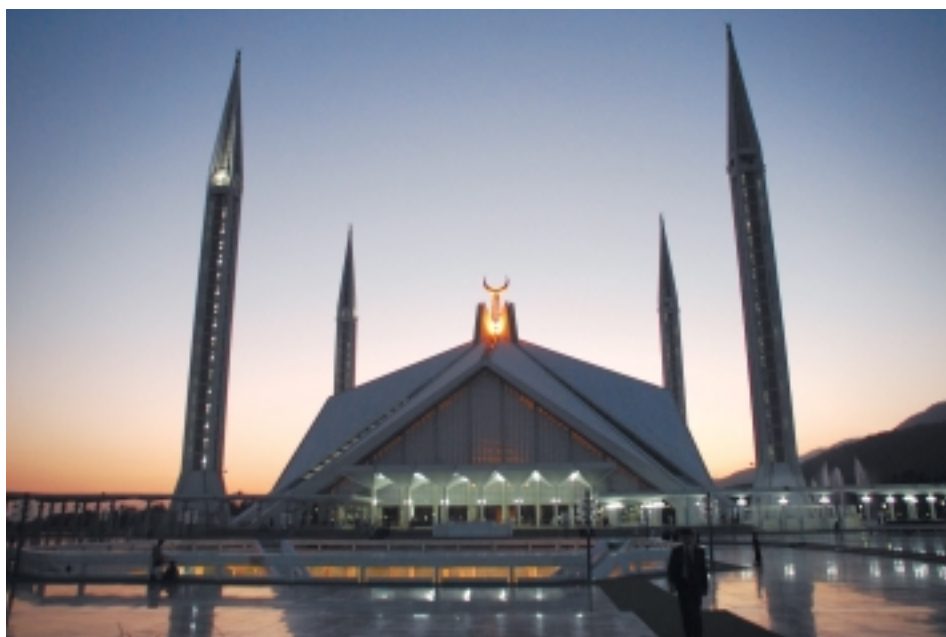
Мечеть Шах-Фейсал-Масджид на закате